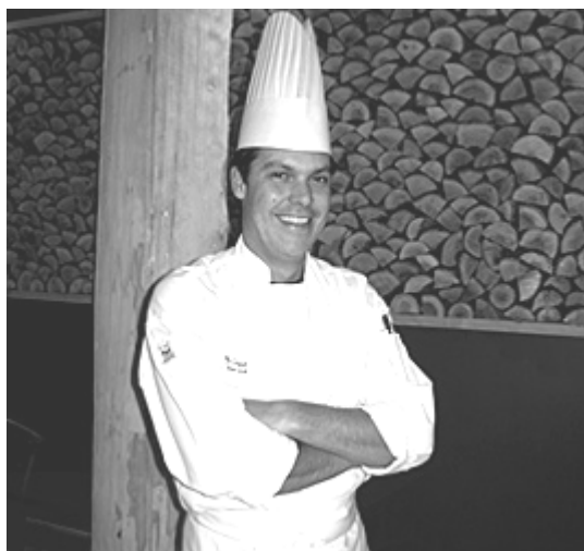
Chef Exécutif Executive Chef

Vivez cette expérience unique dans un cadre enchanteur. Allow us to let you live a unique and inspiring experience.